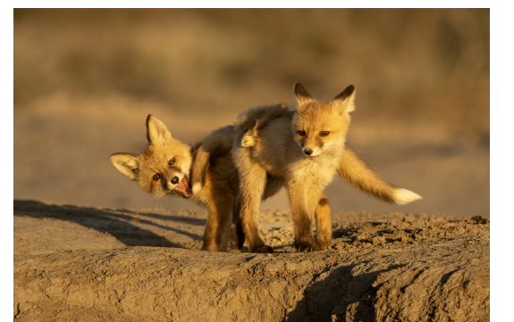
南郊戈壁滩,两只幼狐叠在一起嬉戏。