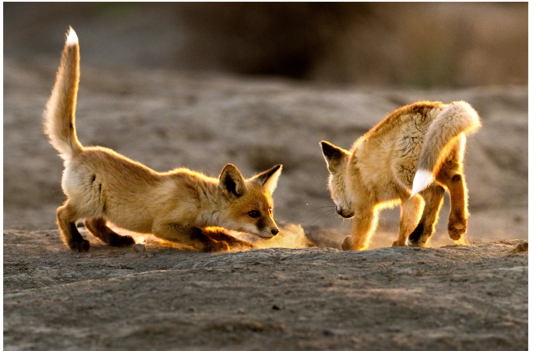
南郊戈壁滩,赤狐幼崽在夕阳下练习捕猎。