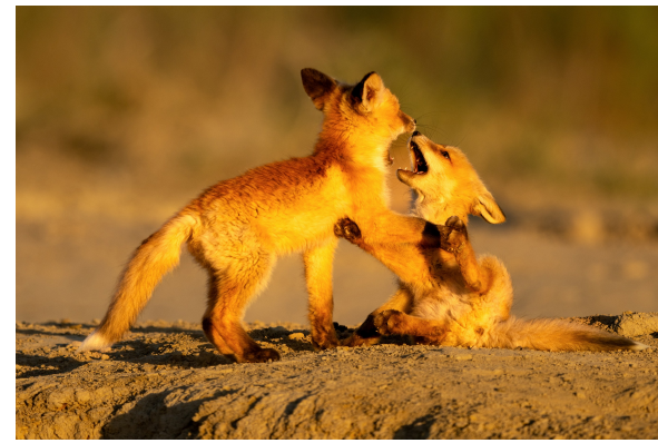
南郊戈壁滩,两只幼狐在夕阳下打闹对峙,练习社交与生存技能。