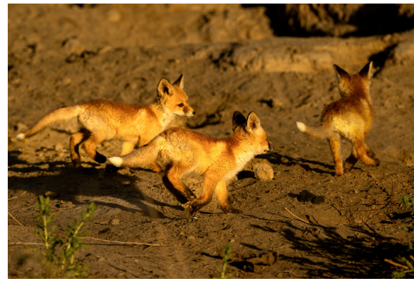
南郊戈壁滩,3只赤狐幼崽在夕阳下奔跑嬉戏,你追我赶间扬起细碎尘土。

面的来信来电信访举报,其他不属于受理范围的信访举报问题,将按规定交由被督察地方处理。