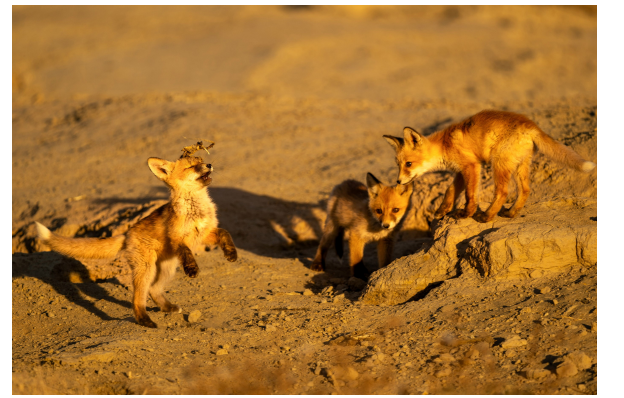
南郊戈壁滩,一只幼狐头顶着猎物残骸蹦跳,另外两只围在一旁,通过嬉戏练习捕猎技巧是他们的天性。