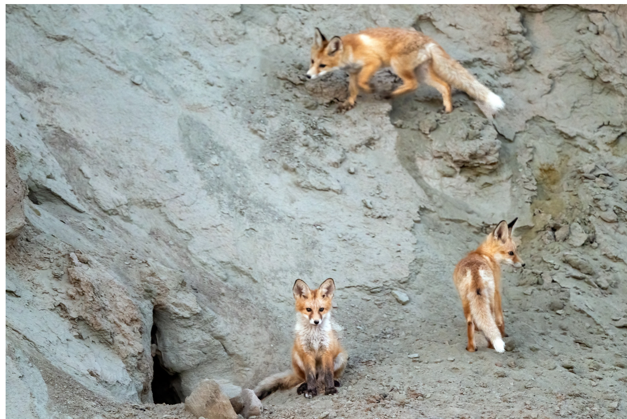
东郊戈壁滩,一群赤狐幼崽在洞穴口四处张望。