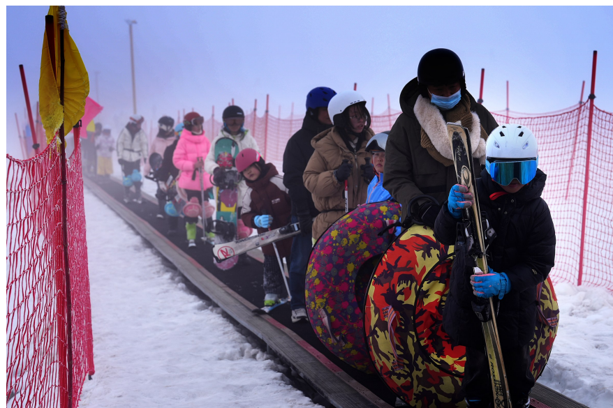
2月21日,独山子区冰峰滑雪场,市民和游客乘魔毯准备滑雪。

速度滑冰赛在此举办,吸引约200名选手参赛;该区还开展了艾里克湖冬捕、魔鬼城冬季摄影等系列活动,其中,“冰封奇境—镜头下的魔鬼城”百名摄影家冬季创作行活动举办,进一步提升了区域冰雪文旅知名度。 市文体旅游局相关负责人表示,2025-2026系列冰雪活动的开展,丰富了市民、游客的冬季文化生活,推动了冰雪运动普及,深化了“冰雪+体育+文旅+美食+研学”的全链条融合模式,为克拉玛依冰雪经济可持续发展奠定了坚实基础。