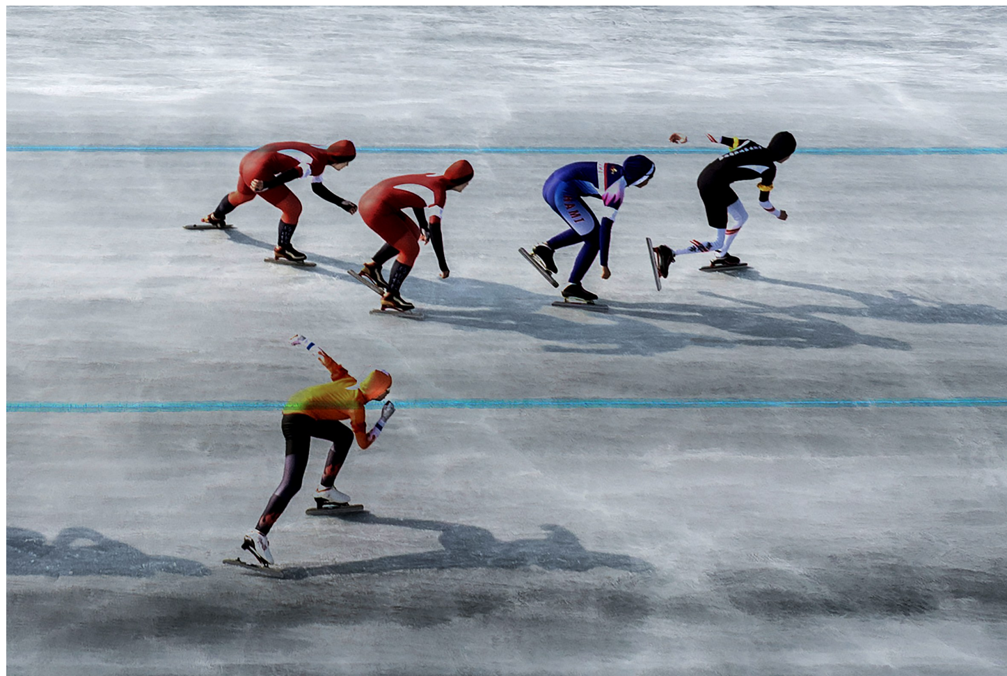
2月11日,金龙湖公园,小选手们在比拼速度。当天,“奔跑吧·少年”全疆青少年速度滑冰锦标赛在这里举行。