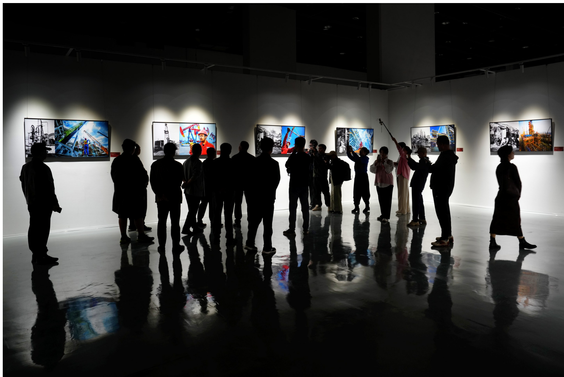
9月27日, 辉煌70年·郭新摄影艺术作品展在克拉玛依科技馆开展, 影展由“七十蝶变”“精灵幻影”“胡杨炫舞”“瑰丽蜃城”“花艳魔都”组成。