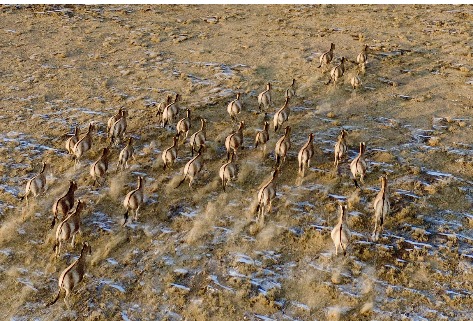
新疆油田火烧山作业区毗邻新疆卡拉麦里山有蹄类野生动物自然保护区,国家一级保护野生动物野驴在迁徙过程中,会进入新疆油田火烧山湿地附近觅食和饮水。