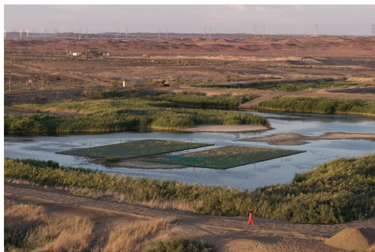
火烧山湿地人工浮岛上种植了水生植物。

本报讯(通讯员 张昀 克拉玛依融媒记者 崔文娟)新疆首个自主贡献型生物多样性保护地——中国石油新疆油田火烧山湿地挂牌设立,标志着新疆干旱区“荒漠化治理+生物多样性保护”有了示范样本。