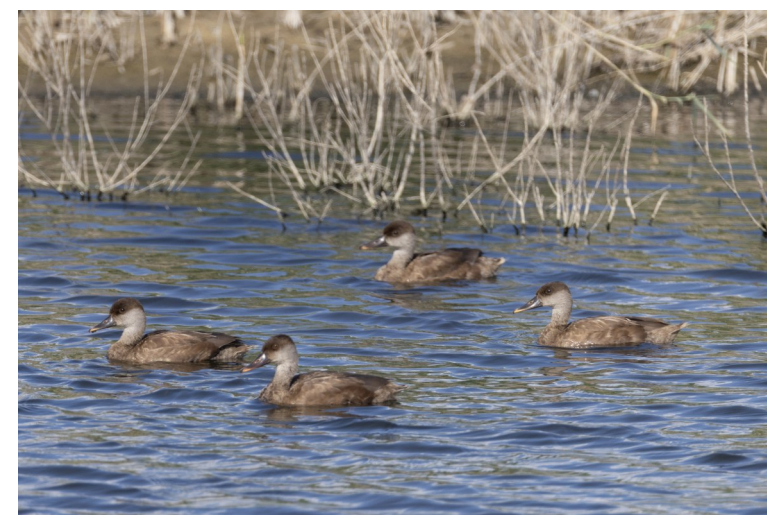
四只赤嘴潜鸭在火烧山湿地栖息。