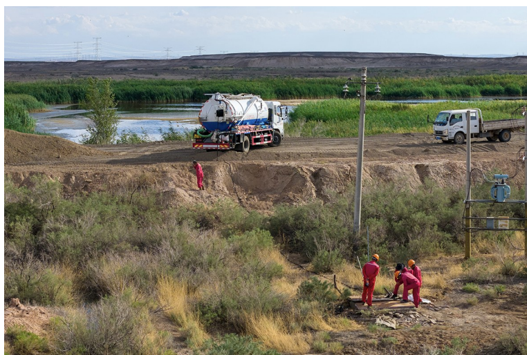
施工人员在为火烧山湿地维护输水管线。