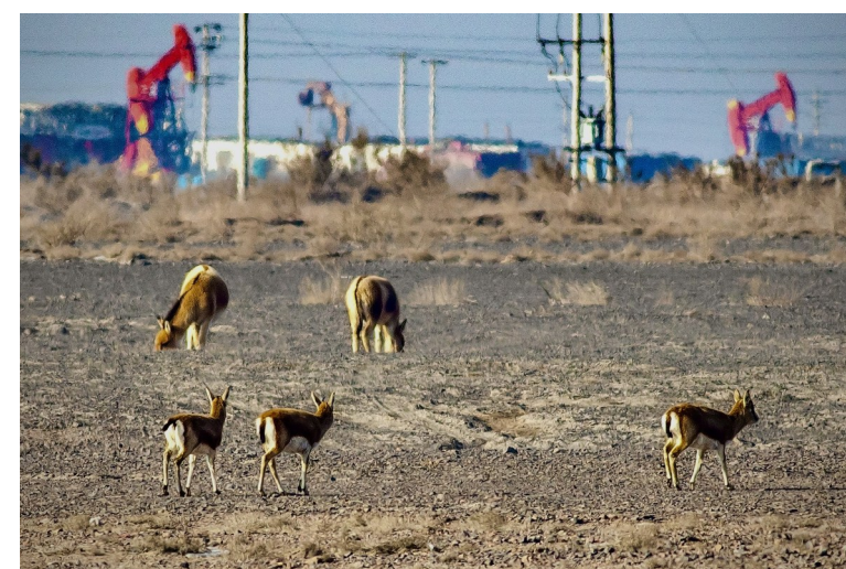
鹅喉羚和野驴在新疆油田火烧山作业区觅食。