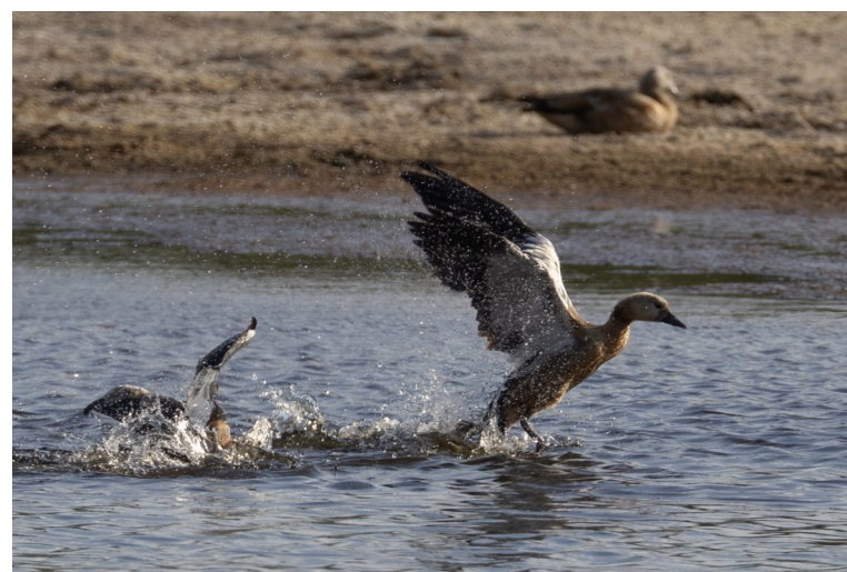
赤麻鸭在火烧山湿地里觅食、嬉戏。