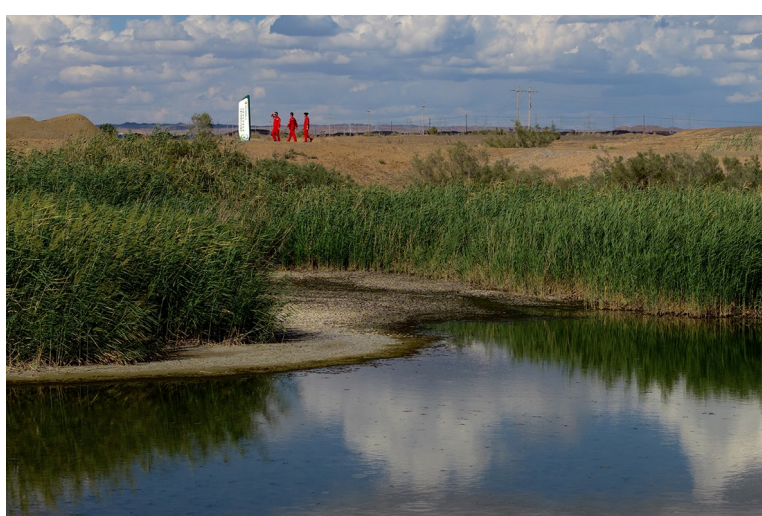
新疆油田火烧山作业区员工在观看标识牌。