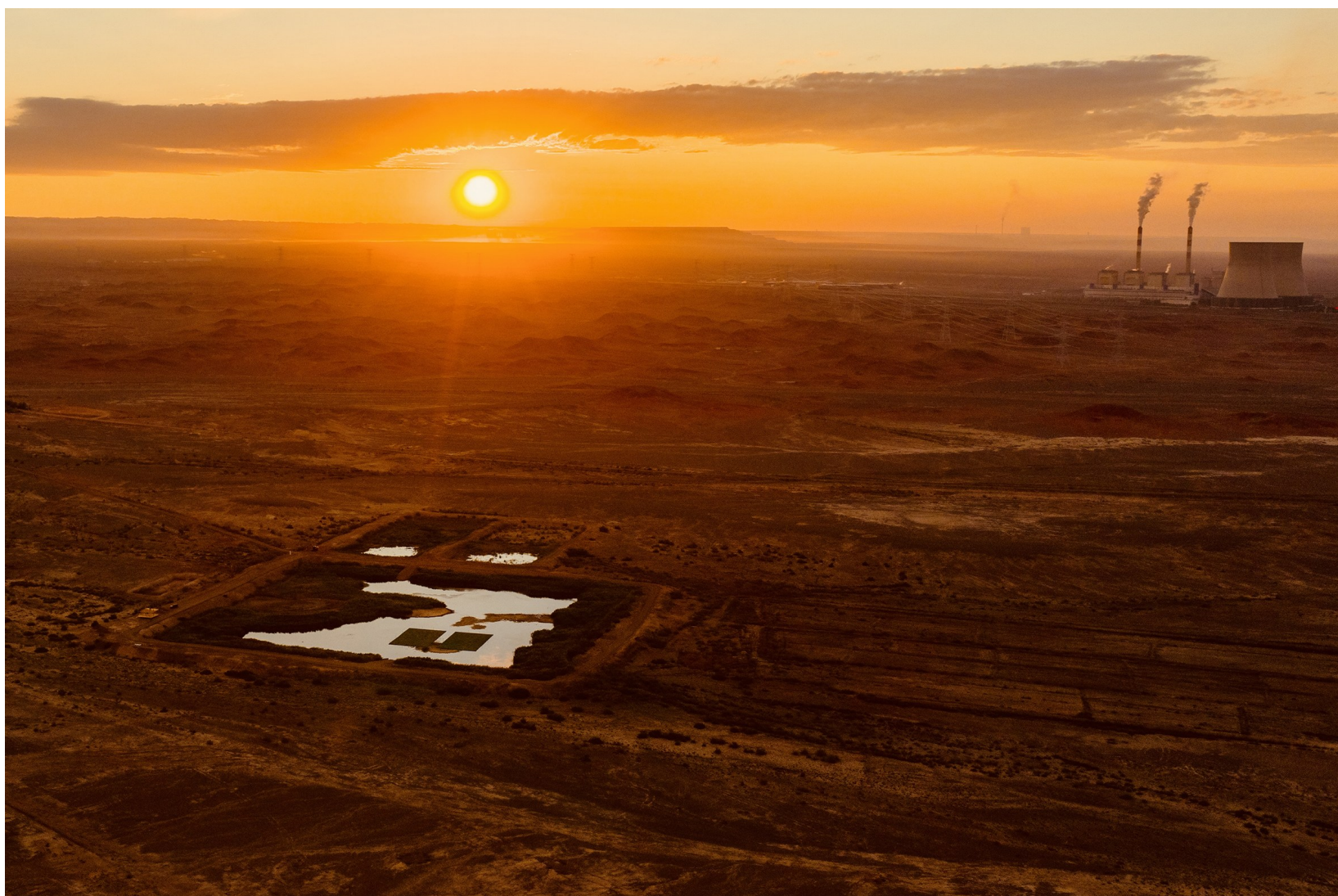
8月15日,新疆首个自主贡献型生物多样性保护地——中国石油新疆油田火烧山湿地挂牌设立。