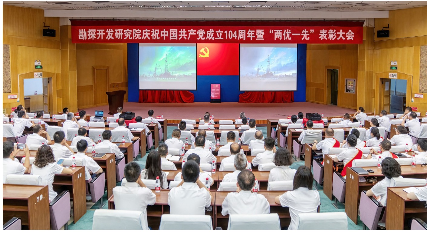
7月1日,新疆油田公司勘探开发研究院召开庆祝中国共产党成立104周年“两优一先”表彰大会暨专题党课。