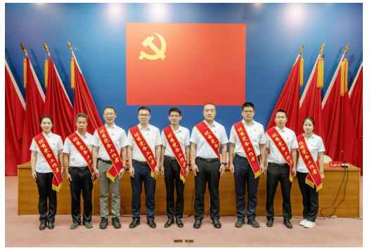
勘探开发研究院2024年度优秀党务工作者合影。