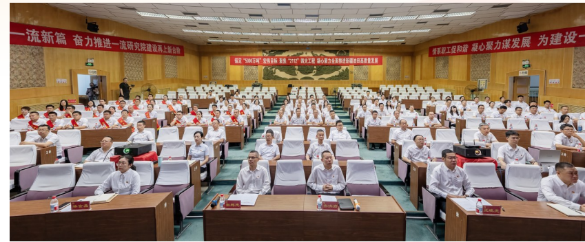
勘探开发研究院130余人参加表彰大会、学习专题党课。