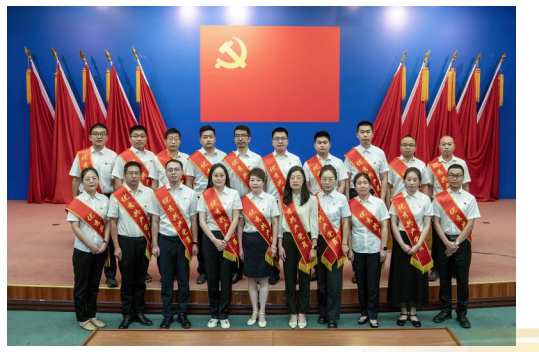
勘探开发研究院2024年度优秀共产党员代表合影。