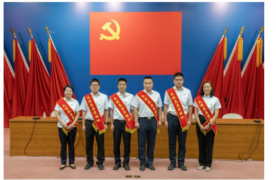
勘探开发研究院2024年度先进基层党组织代表合影。