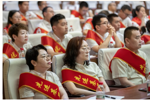
参会人员认真聆听专题党课。