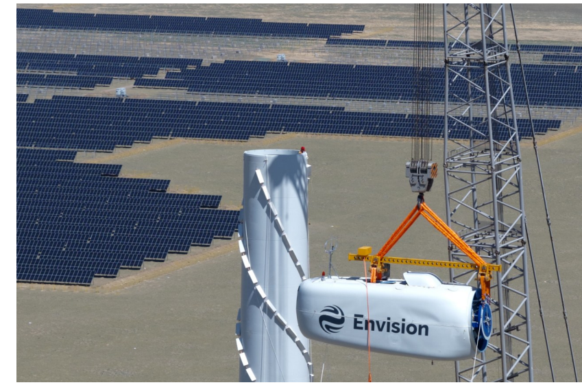
巨型吊装机正在缓缓将风机机舱送上塔顶。