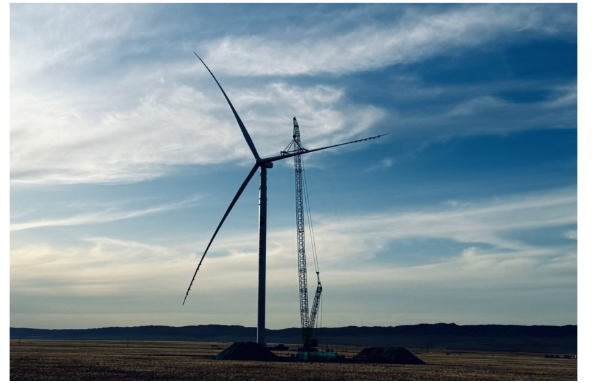
▲首台安装成功的7.5兆瓦风机静默矗立在草原之上。 ▲风机塔筒上“中国石油”的大字熠熠生辉。