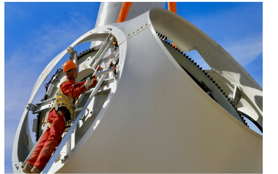
轮毂导流罩安装前,施工人员正在打密封胶。