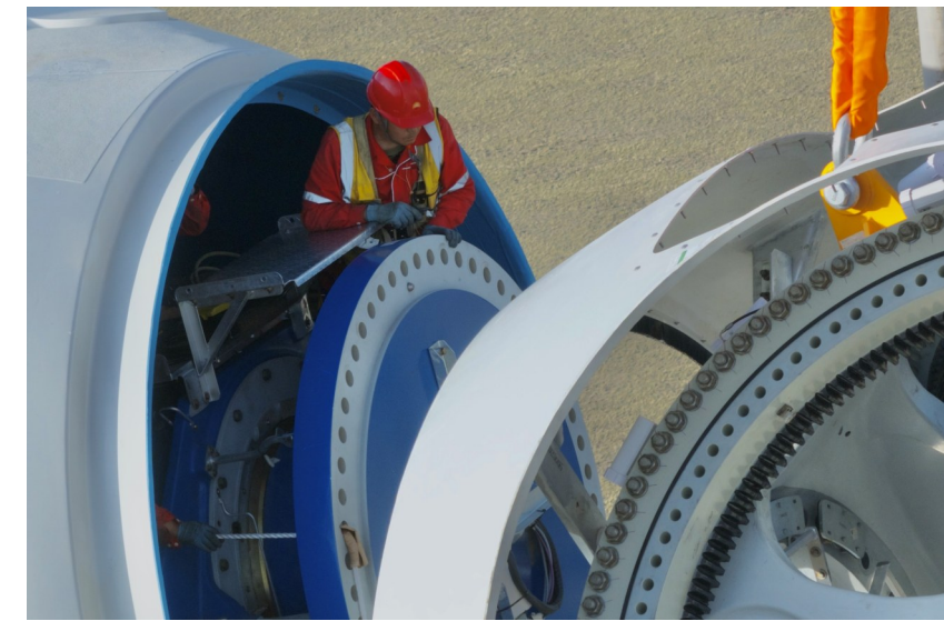
施工人员在高空中进行轮毂与机舱的对接。