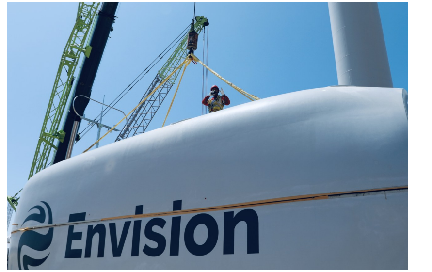
设备吊装人员正在仔细检查机舱吊装的绳索。